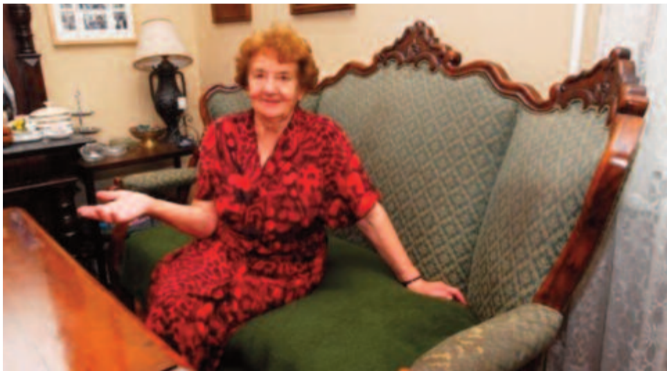
A patinás Jókai-kanapé