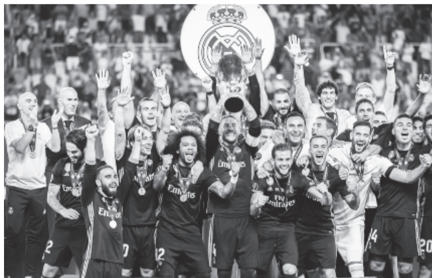
A spanyol klub régóta látott bravúrt ért el keddi győzelmével, hiszen két egymást követő évben nyerte meg a Bajnokok Ligáját és az európai Szuperkupát is, ez pedig legutóbb az AC Milannak sikerült 1989-ben és 1990-ben

A Real Madrid sikerével története során negyedszer hódította el a trófeát, s egy mást követő két évben nyerte meg a Bajnokok Ligáját és az európai Szuperkupát is, ez legutóbb az AC Milannak sikerült 1989-ben és 1990-ben.