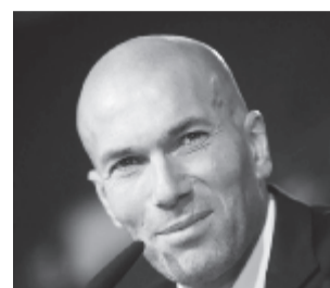
Zinédine Zidane szerint a Real kézbentartotta a Manchester United elleni finálét

„A győzelmünknek két záloga volt. Az egyik, hogy kontroll alatt tartottuk a mérkőzést, a másik, hogy a legjobb pillanatban használtuk ki a lehetőségeinket” – mondta Zinédine Zidane. A