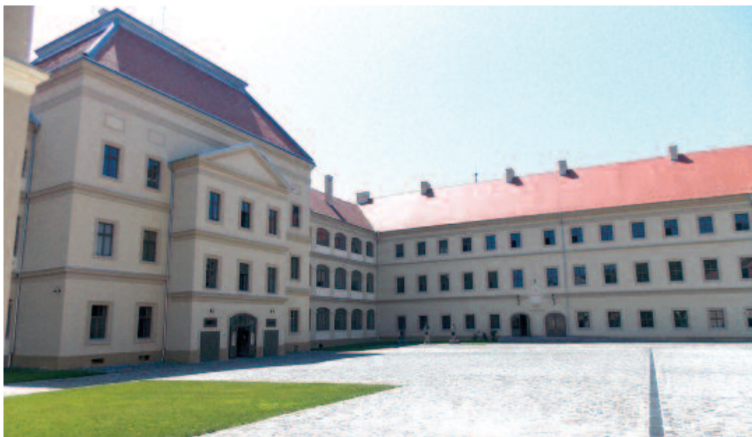
A felújított nagyenyedi Bethlen Gábor Kollégium