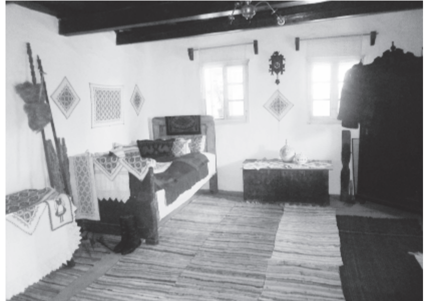
A most átadott tájház nemcsak a tárgygyűjteménynek ad otthont, hanem többfunkciós épület is lehet a jövőben